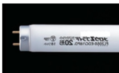
直管型蛍光灯ランプ