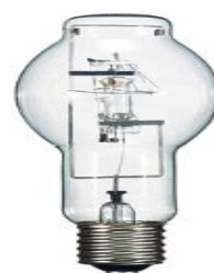
メタルハライドランプ 高圧ナトリウムランプ