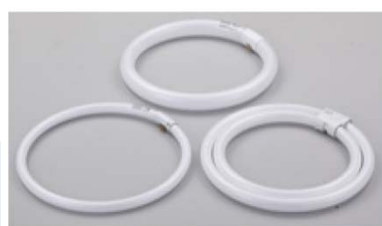
環形蛍光灯ランプ